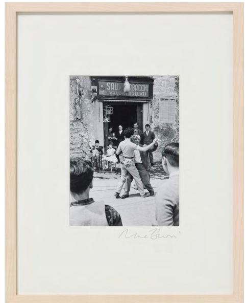
Strassentheater, Napoli, 1956