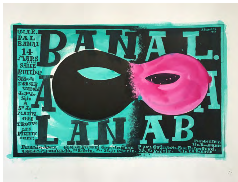
Bal Banal, 1924 (positiv)